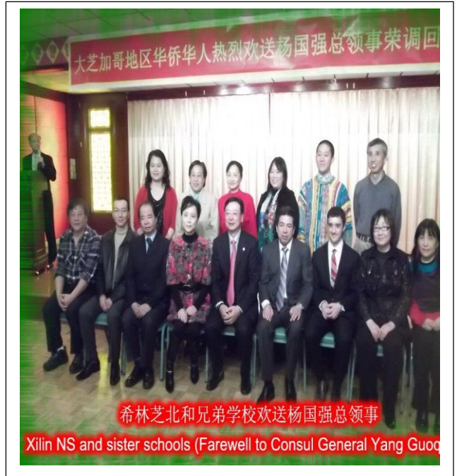
希林芝北和兄弟学校欢送杨国强总领事 Xilin NS and sister schools (Farewell to Consul General Yang Guoqiang)